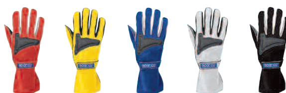
00133TW..R 00133TW..GI 00133TW..A 00133TW..GR 00133TW..N

• Esta luva profissional de uma cor é produzida na tela de Nomex® com reforço da junta no material aramidyic, em emendas externas e na forma de couro ergonômica na palma. Pré-formado para o conforto do aumento e o sistema do fechamento da cinta no pulso.