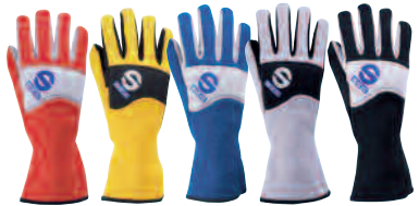
00137X..RS 00137X..AZ 00137X..NR 00137X..G 00137X..GR

• Luva confortável, anatómica e forte com emendas internas. Inserções do couro do suede na palma para um aperto elevado. Reforço da junta realizado com um sanduíche especial na espuma e no Nomex® à prova de fogo. Espuma do estofamento na parte mais inferior da palma. Fechamento elástico no pulso. Logo de Sparco bordado sobre para trás.