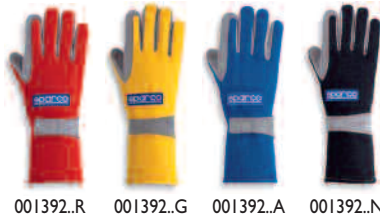
001392..R 001392..G 001392..A 001392..N

• Este modelo de luva é extremamente profissional, oferece alta performance com um ótimo preço. Palma reforçada. Fabricada com tecido Nomex®.