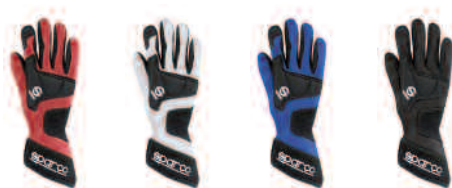
001352NP.RS 001352NP.BI 001352NP.AZ 001352NP.NR

• É uma luva que faltava na gama, mais tradicional que as outras e com costuras internas, tem uma ótima relação conforto/desempenho graças aos acabamentos particularmente cuidadosos. Os reforços em couro na palma são dispostos para auxiliar os movimentos da mão e garantem uma excelente aderência.