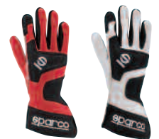
00135 INS..RS 00135 INS..BI