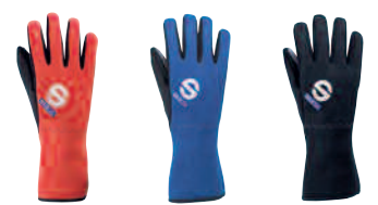
00136X..RS 00136X..AZ 00136X..NR

• Luva da qualidade elevada com emendas internas. Palma revestida no couro do suede para um aperto melhor. Fechamento elástico no pulso. Logo impresso de Sparco na parte traseira e na parte traseira do pulso.