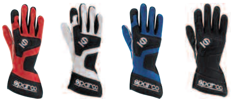
00135 INV..RS 00135 INV..BI 00135 INV..AZ 00135 INV..NR

• Revolucionário, inovador e prático. São todos adjetivos adequados a esta nova luva. O material HTX aplicado em 3D com um molde especial a vulcão vazio no interior, trabalha durante a direção como amortecedor para as vibrações transmitidas pelo volante. A consistência e a irregularidade da superfície garantem uma presa notável. A dimensão dos vulcões, variável segundo a área, foi projetada para ser mais alta nas áreas de maior gasto. A disposição ergonómica das zonas tratadas garante uma extrema facilidade de presa da mão e um conforto absoluto.