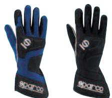
00135 INS..AZ 00135 INS..NR