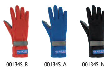
00134S..R 00134S..A 00134S..N

• Este modelo de luva em Nomex®, é muito confortável, extremamente segura, com ampla opções de cores.