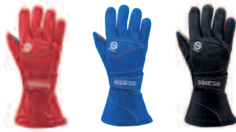
00139F..RS 00139F..AZ 00139F..NR