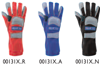
00131X..R 00131X..A 00131X..N

• A luva X-Pro é muito avançada em termos de vestimenta e matéria-prima utilizada. A modelagem pré-curvada, as costuras especiais e reforços acolchados protegem o piloto em qualquer condição de corrida. Couro reforçado com alta aderência. Fabricada com tecido Nomex®.